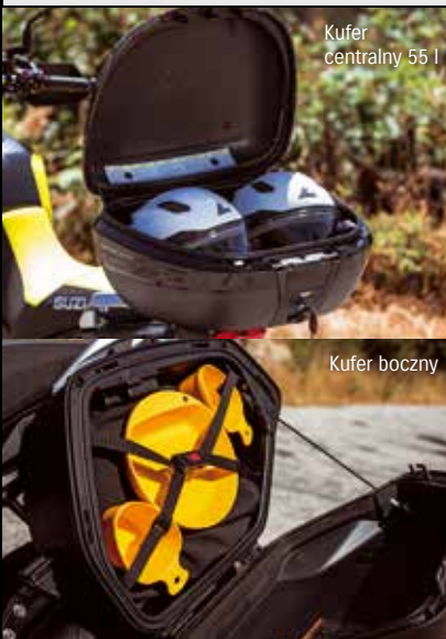
Kufer centralny 55 l