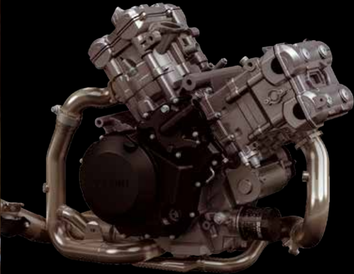
Silnik V-Twin 90° DOHC 1037 cm 3

Mocny i wszechstronny silnik w konfiguracji V-Twin 90° DOHC narodził się jako jednostka o pojemności 996 cm 3 i przeszedł gruntowną modernizację, zmieniając różne komponenty i zwiększając pojemność do 1037cm 3 w 2014 roku. Mocny, z natury przyjazny kierowcy V-Twin, bez wysiłku zapewnia przyspieszenia odpowiadające każdej sytuacji drogowej, także z pasażerem za plecami. Moc maksymalna wynosząca