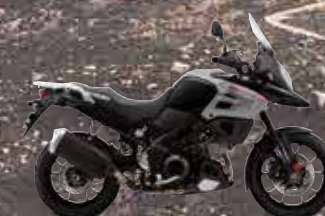
Glass Sparkle Black (YVB)