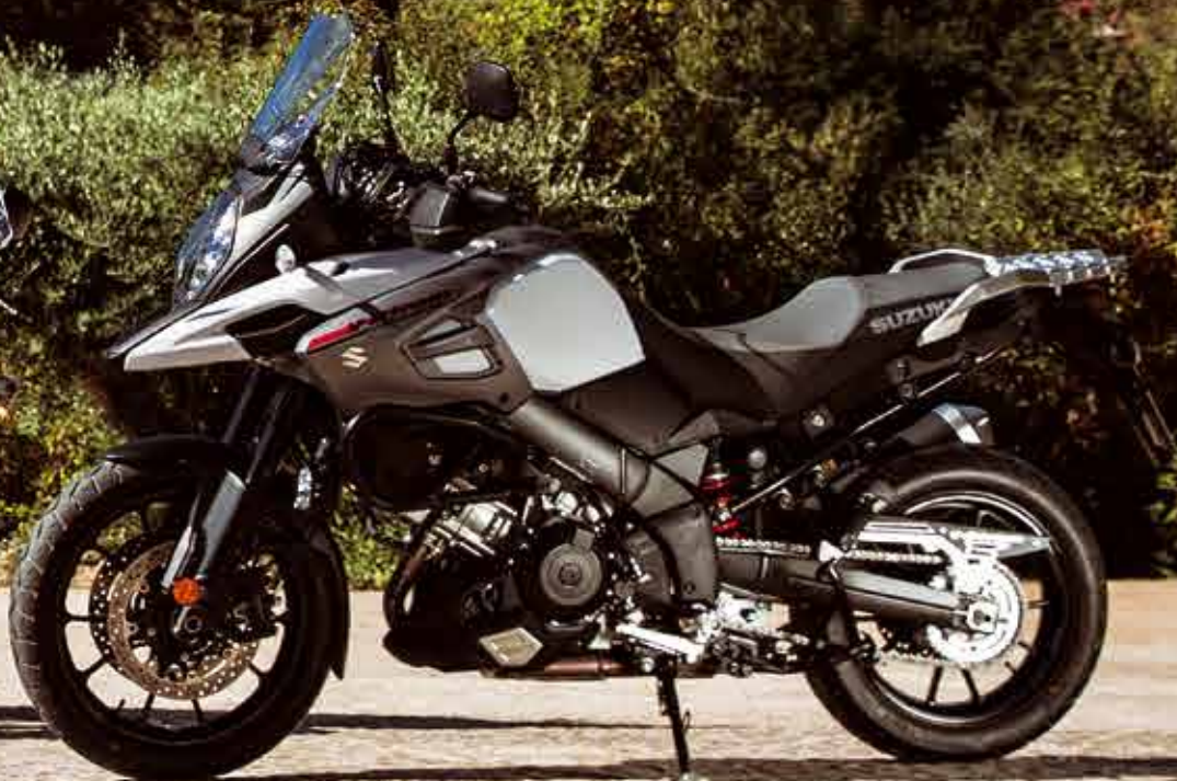
V-Strom 1000 ABS

Porzuć swoją codzienną rutynę. Na wiatr wyrzuć przyzwyczajenia. Wybierz się w daleką podróż, w góry, za granicę. Radosny charakter i efektowny silnik uwolni Cię i pozwoli rozwinąć skrzydła. Oddychaj świeżym powietrzem, zanurz się w dzikiej przyrodzie, zasmakuj przygody.