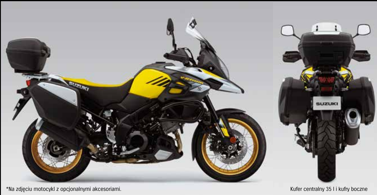
*Na zdjęciu motocykl z opcjonalnymi akcesoriami.