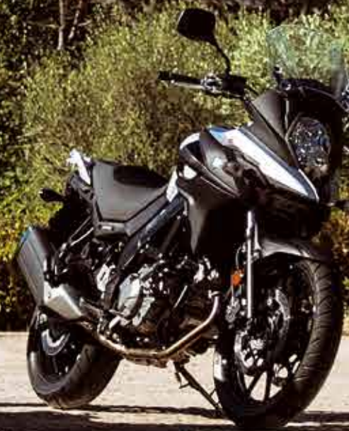
V-Strom 650 ABS