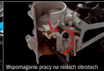
Wspomaganie pracy na niskich obrotach