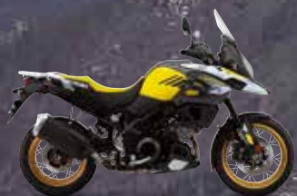
Champion Yellow No.2 (YU1)