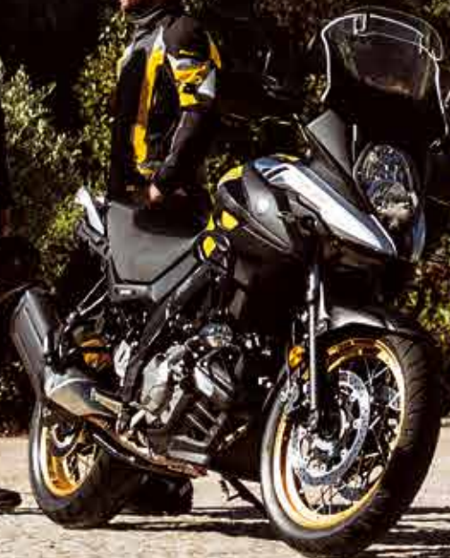
V-Strom 650XT ABS