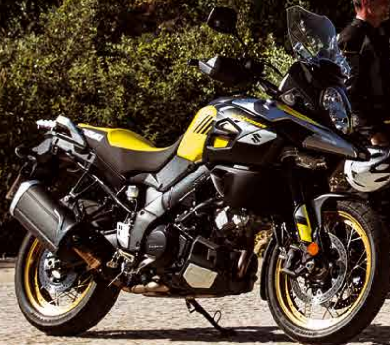
V-Strom 1000XT ABS