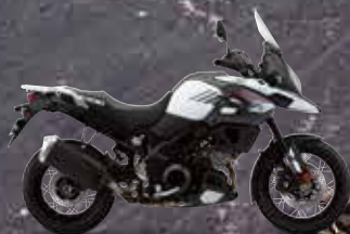
Pearl Glacier White (YWW)