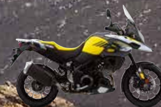
Champion Yellow No.2 (YU1)