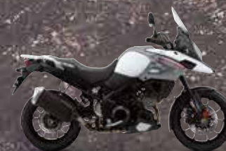
Pearl Glacier White (YWW)