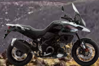
Glass Sparkle Black (YVB)