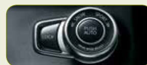
Zaawansowany napęd na 4 koła ALLGRIP