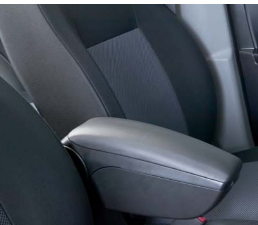
Podłokietnik między fotelami Ze schowkiem

W swoim SX4 możesz rozsiąść się wygodnie i rozluźnić. Rozkoszować się wygodnym wnętrzem i wyposażeniem dostępnym na wyciągnięcie ręki, tak przydatnym w drodze. Ale SX4 jest także otwarty na inicjatywy Twoje i Twoich gości, nawet tych najmniejszych. Skorzystaj z ich sugestii i wybierz atrakcyjne, oryginalne akcesoria Suzuki.