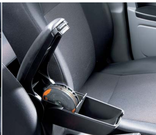
Podłokietnik między fotelami Ze schowkiem i pojemnikiem na płyty CD