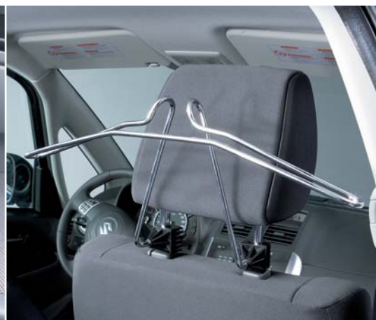
Wieszak na ubrania Montowany za zagłówkiem przedniego fotela, 1 sztuka w komplecie