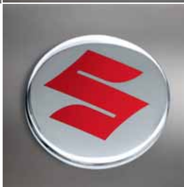
21 | Osłona piasty „Red” z logo „S” na polerowanym tle, tylko do felg ze stopu lekkiego „Chrono”