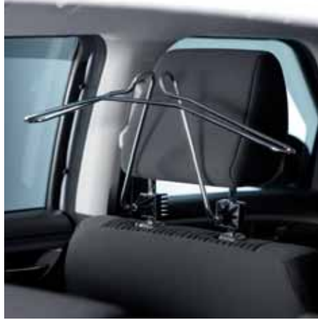
3 | Wieszak na ubrania mocowany do zagłówka przedniego fotela, 1 sztuka Nr ewid. 990E0-79J89-000