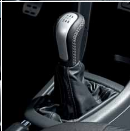
6 | Gałka dźwigni zmiany biegów w komplecie skórzana osłona dźwigni ze szwem w kolorze srebrnym Nr ewid. 990E0-68L36-000