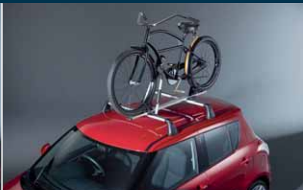
11 | Stelaż do transportu rowerów 1 do przewożenia kompletnych rowerów Nr ewid. 990E0-59J20-000