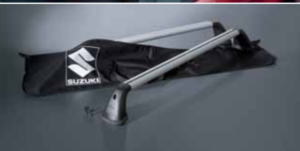
14 | Worek na poprzeczki bagażnika dachowego czarny, z dużym logo Suzuki Nr ewid. 990E0-79J91-000