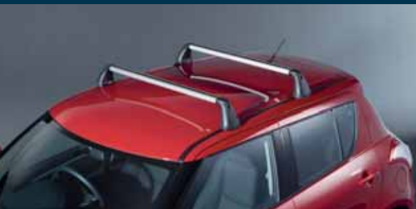
13 | Poprzeczki bagażnika dachowego 1 aluminiowe, ze szczeliną Nr ewid. 990E0-68L33-000