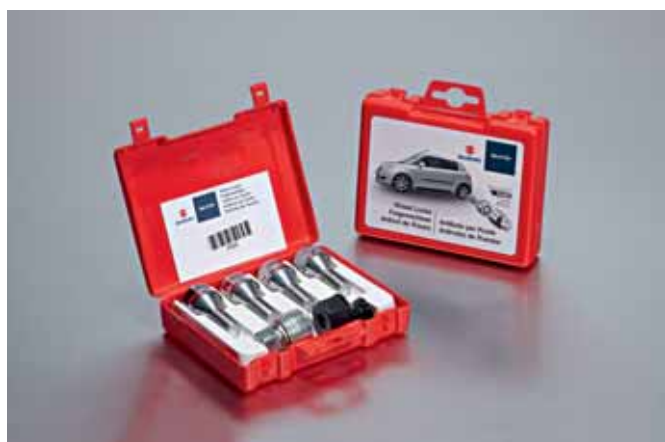
22 | Śruby antykradzieżowe „Sicustar” z homologacją Thatcham Nr ewid. 990E0-59J46-000