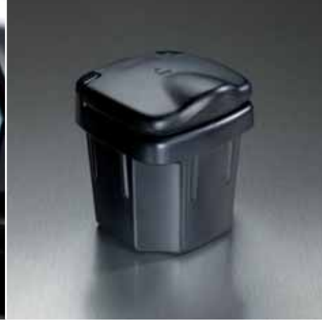
4 | Popielniczka Nr ewid. 89810-86G10-5PK