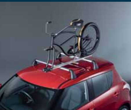
10 | Stelaż do transportu rowerów 1 do przewożenia rowerów ze zdjętym przednim kołem Nr ewid. 990E0-59J21-000