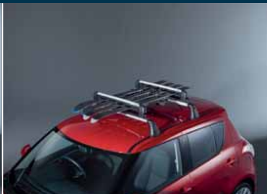
12 | Uchwyt do nart 1 na 6 par nart lub 4 deski snowboardowe Nr ewid. 99000-990YT-107