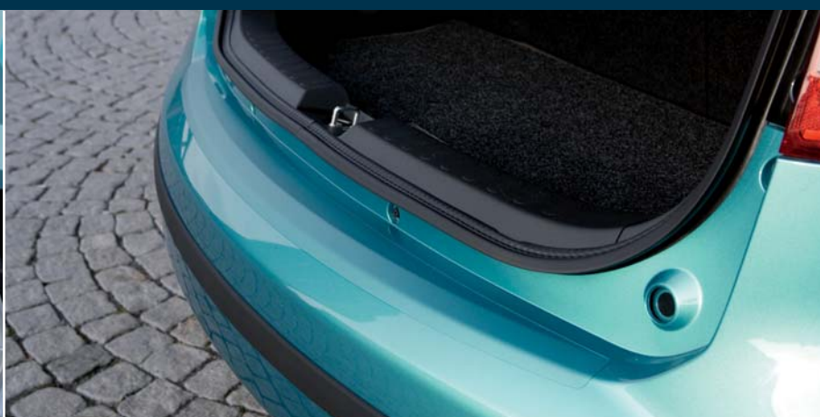
Nakładka ochronna na zderzak przezroczysta Nr ewid. 990E0-51K16-001