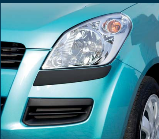
Nakładki ochronne na naroża zderzaków komplet na przedni i tylny zderzak, 3 sztuki Nr ewid. 990E0-51K06-000