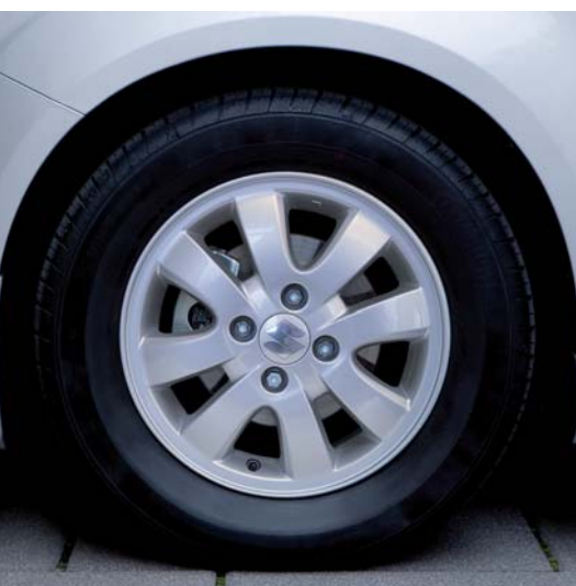
Felga aluminiowa „Jupiter” 5 J x 14” odpowiednia do opon radialnych 165/70 R14 81T, mocowana fabrycznymi nakrętkami do kół Nr ewid. 990E0-51K58-000