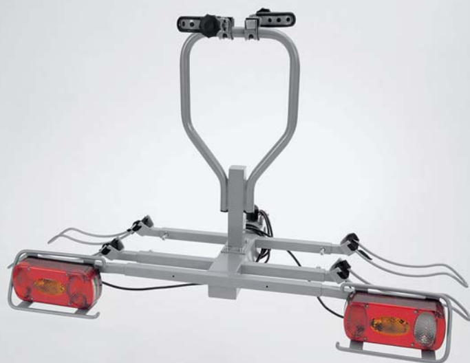
Stelaż do transportu rowerów „Carac” na dwa rowery, konstrukcja stalowa, mocowanie wyłącznie na haku holowniczym Nr ewid. 990E0-62J66-000