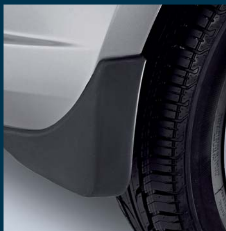
Oslony przeciwbłotne 1 sztywne, przednie, możliwe polakiero- wanie w kolorze nadwozia (brak ilustr.) Nr ewid. 990E0-51K07-000