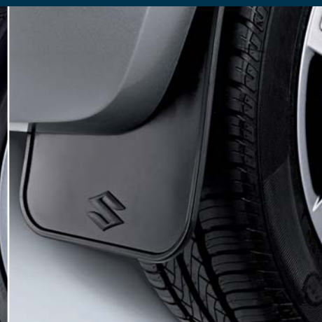
Oslony przeciwbłotne 1 elastyczne, przednie (brak ilustr.) Nr ewid. 990E0-51K25-000