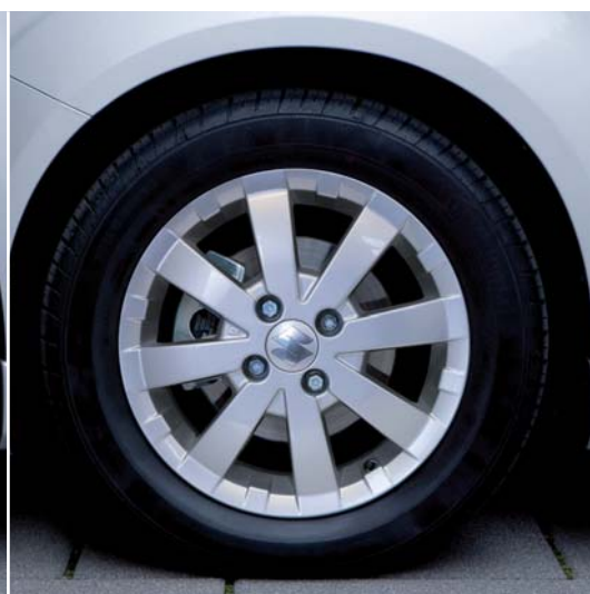
Felga aluminiowa „Omega” 5,5 J x 15” odpowiednia do opon radialnych 185/60 R15 84H, mocowana fabrycznymi nakrętkami do kół Nr ewid. 990E0-51K59-000