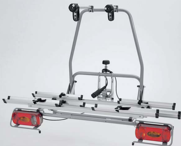
Stelaż do transportu rowerów „Vario” na dwa rowery, konstrukcja aluminiowa, mocowanie wyłącznie na haku holowniczym Nr ewid. 990E0-62J67-000

Uzupełnienie gamy wygodnych akcesoriów do transportu na dachu samochodu oraz potężnej przestrzeni bagażowej. Stelaż do przewożenia sprzętu sportowego – takiego jak rowery i deski – z tyłu samochodu, czy też hak holowniczy rozszerzają możliwości transportowe. Splash oferuje szeroki wybór nieskomplikowanych sposobów zabrania ze sobą wszystkiego, co potrzebne, bez uszczerbku dla komfortu podróżnych. I bez kompromisów.