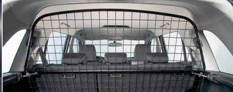
Krata odgradzająca przestrzeń bagażową pełnowymiarowa