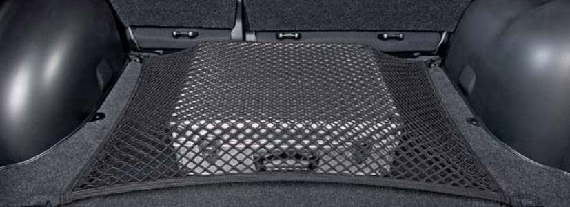
Siatka do unieruchomienia przedmiotów przewożonych na podłodze bagażnika