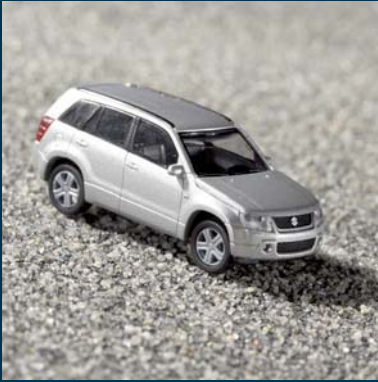
Model samochodu Grand Vitara 5-drzwiowy srebrny, skala 1:87 (H0) Nr ewid. 990E0-65J26-000