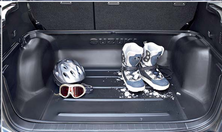
Głęboka wykładzina bagażnika

do stosowania wyłącznie po złożeniu tylnych siedzeń, wykonana z wytrzymałego materiału, z logo Suzuki