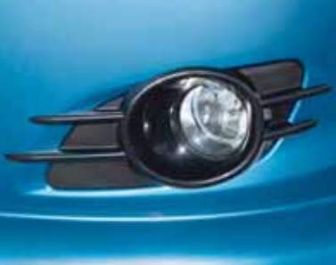
Ramka przednich świateł przeciwmgielnych, żebrowana czarna, możliwe polakierowanie Nr ewid. 990E0-68K10-000