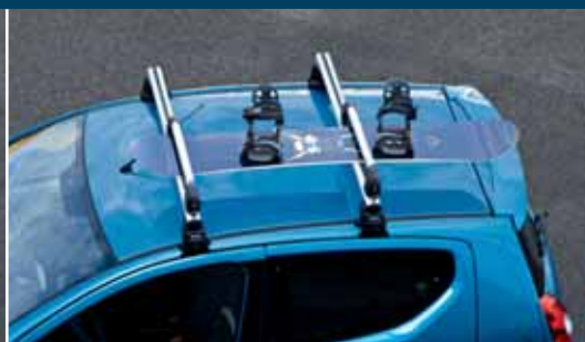
Uchwyt do nart „McKinley” 1,2 na 4 pary nart lub 2 deski snowboardowe Nr ewid. 99000-990YT-106