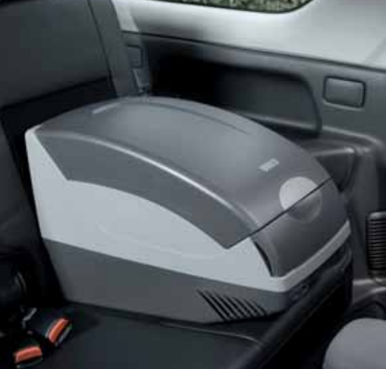
Chłodziarka Waeco pojemność 15 l (na ilustr. w modelu Jimny) Nr ewid. 990E0-64J30-000