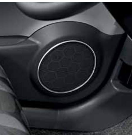
Obramowanie głośnika chromowane, 4 sztuki Nr ewid. 990E0-68K21-000