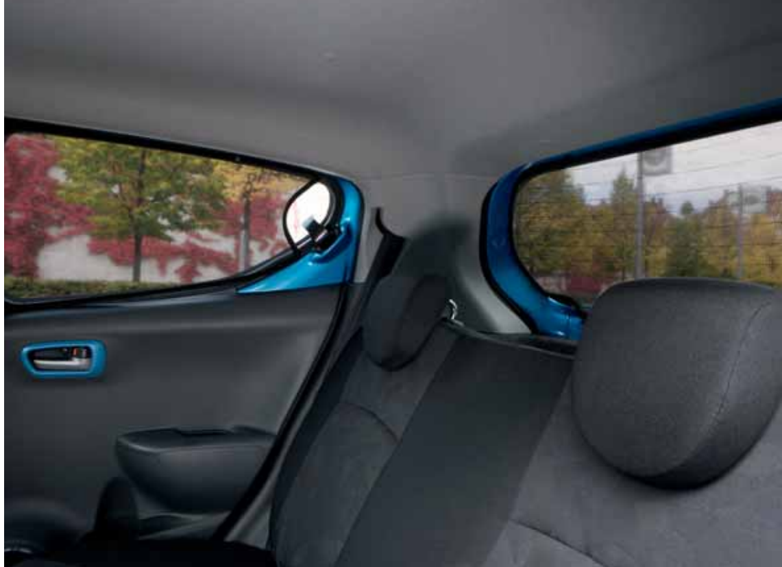
Komplet osłon przeciwsłonecznych na szyby czarne, 3 sztuki Nr ewid. 990E0-68K19-000