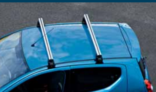
Poprzeczki bagażnika dachowego 1 owalne profile aluminiowe, ze szczeliną Nr ewid. 990E0-68K33-000