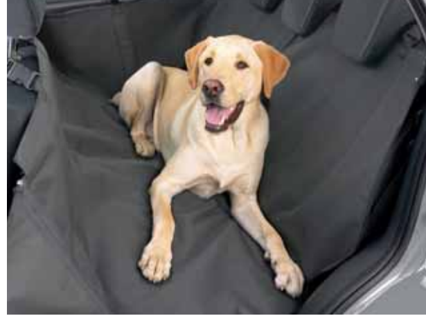
Pokrowiec ochronny na siedzenie do przewożenia psa na tylnym siedzeniu (na ilustr. w modelu SX4) Nr ewid. 990E0-79J44-000