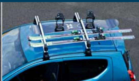
Uchwyt do nart „Everest” 1,2 na 6 par nart lub 4 deski snowboardowe (brak ilustr.) Nr ewid. 99000-990YT-107