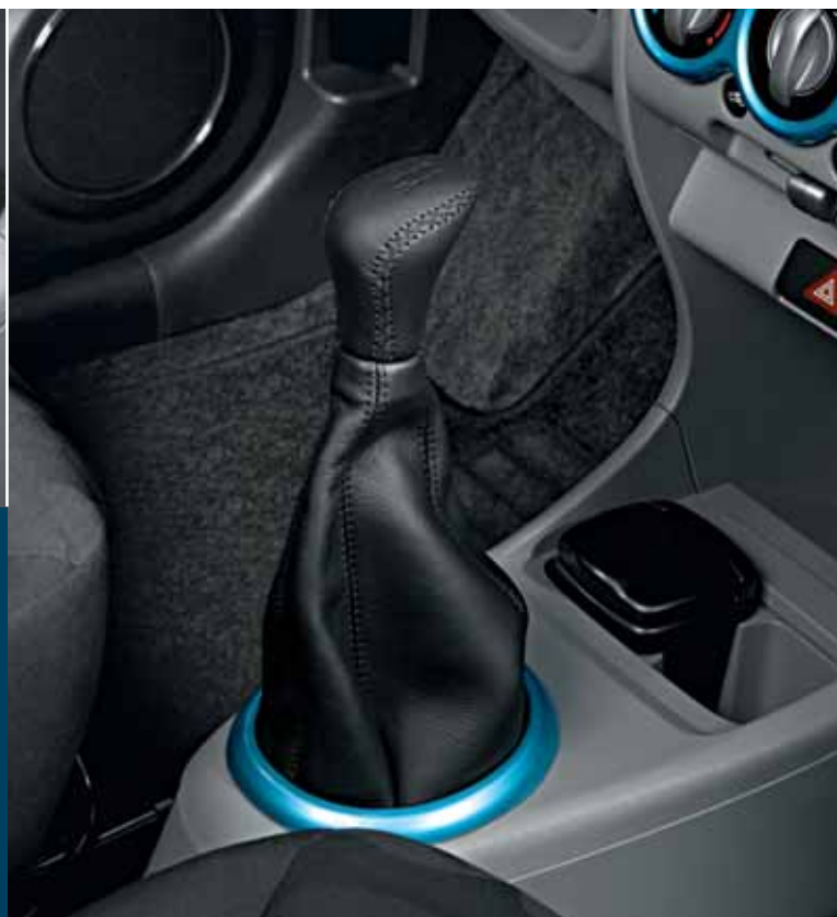
Skórzane wykończenie dźwigni skrzyni biegów skórzana gałka i worek dźwigni; nie zawiera kolorowej oprawy dźwigni Nr ewid. 990E0-68K37-000