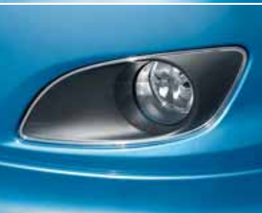
Oprawa przednich świateł przeciwmgielnych chromowana Nr ewid. 990E0-68K24-000