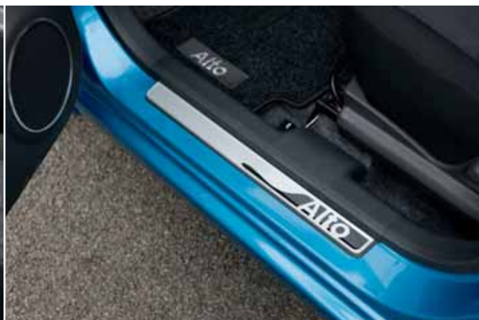
Nakładki na progi drzwi 4 sztuki Nr ewid. 990E0-68K27-000