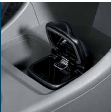
Popielniczka czarna Nr ewid. 89810-86G10-5PK