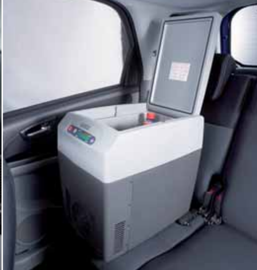
Chłodziarka z mocowaniem ISOFIX, pojemność 21 l (na ilustr. w modelu SX4) Nr ewid. 990E0-64J23-000