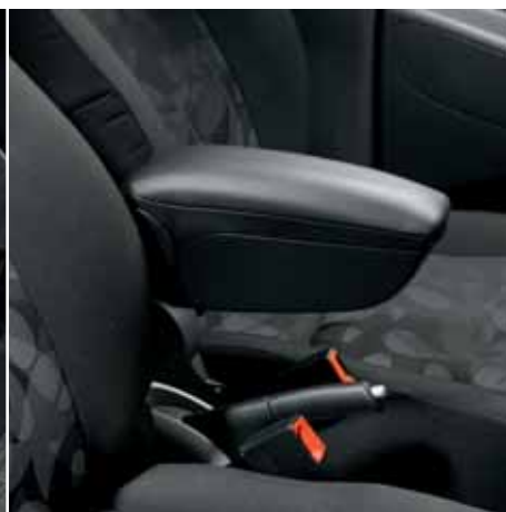
Środkowy podłokietnik ze schowkiem Nr ewid. 990E0-68K15-000